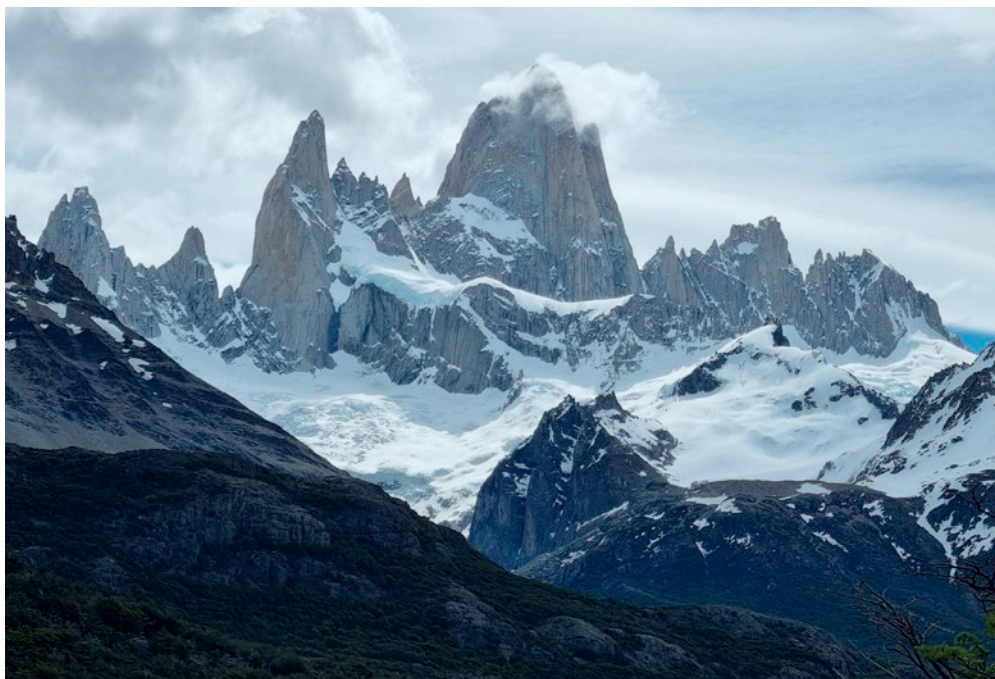
Fitz Roy o Cerro Chaltén. Argentina

Sense res previst. Caminant d'esma pels senders patagònics em vaig anar topant amb algunes orquídiades. Pel que explicaven la gent d'allà, aquest havia estat un hivern llarg, plujós i amb molta neu. Encara en quedava força, de neu, molta més del que seria habitual per l'època. Vaig trobar en molts llocs moltes fulles d'orquídiades desconegudes, a les que encara els hi quedaven setmanes per florir, doncs tot just algunes poques començaven a esbossar la tija floral. Centenars, o milers. Si totes floreixen poden ser llocs espectaculars de veure. L'espècie més abundant i que vaig trobar florida a més llocs va ser les que ells anomenem la palomita (Codonorchis lessonii) . La vaig veure en flor tant a Bariloche com al Chaltén i a Tierra de Fuego, formant extenses i nombroses colònies a l'ombra del bosc.