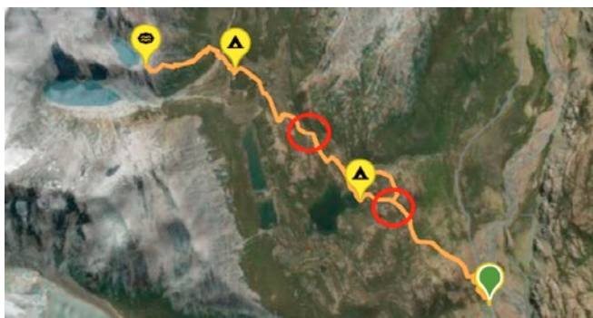
[Esquerra] Itinerari Sendero Fitz Roy - Laguna de los tres. El Chaltén amb localitzacions de Codonorchis lessonii