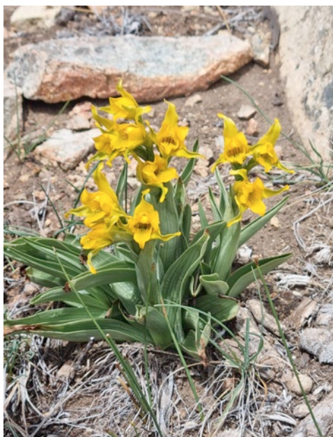
[Esquerra] Chloraea alpina . El Bolsón (Rio Negro), Argentina

Sense res previst. Caminant d'esma pels senders patagònics em vaig anar topant amb algunes orquídiades. Pel que explicaven la gent d'allà, aquest havia estat un hivern llarg, plujós i amb molta neu. Encara en quedava força, de neu, molta més del que seria habitual per l'època. Vaig trobar en molts llocs moltes fulles d'orquídiades desconegudes, a les que encara els hi quedaven setmanes per florir, doncs tot just algunes poques començaven a esbossar la tija floral. Centenars, o milers. Si totes floreixen poden ser llocs espectaculars de veure. L'espècie més abundant i que vaig trobar florida a més llocs va ser les que ells anomenem la palomita (Codonorchis lessonii) . La vaig veure en flor tant a Bariloche com al Chaltén i a Tierra de Fuego, formant extenses i nombroses colònies a l'ombra del bosc.