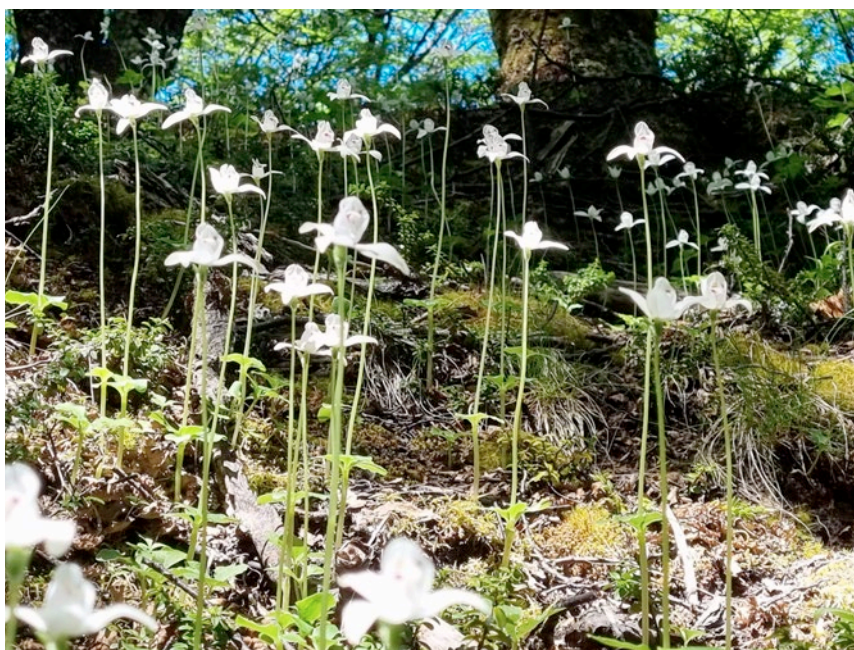
[A dalt, a l'esquerra] Codonorchis lessonii al Bosque de los Arrayanes