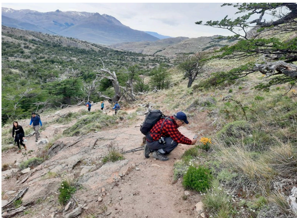
Hàbitat de la Chloraea alpina a El Chaltén. Prats assolellats i pedregosos en vessant nord.