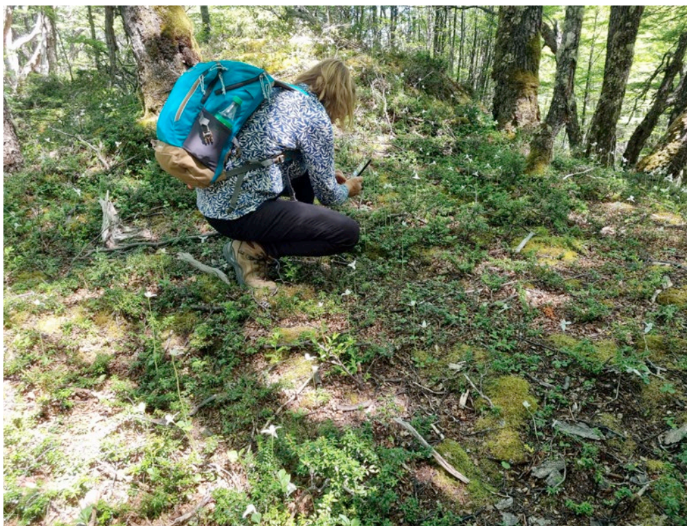
[Dreta] Codonorchis lessonii al Sendero Glaciar Huemul. 5-12-2023