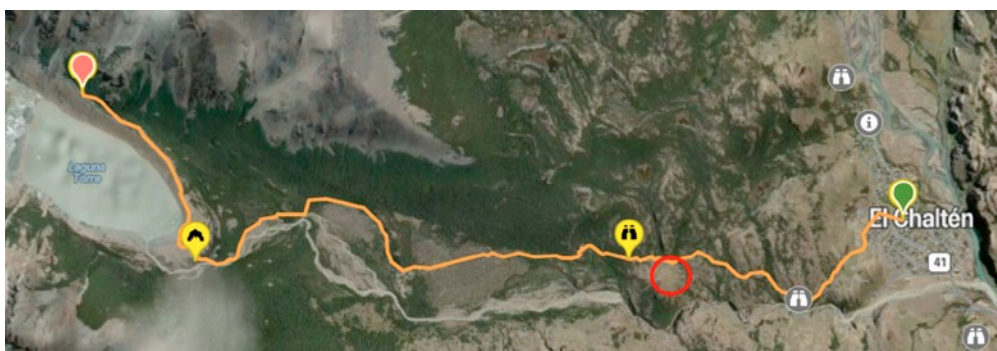
Itinerari El Chaltén-Laguna Torre-Mirador Maestri amb la localització de Chloraea alpina