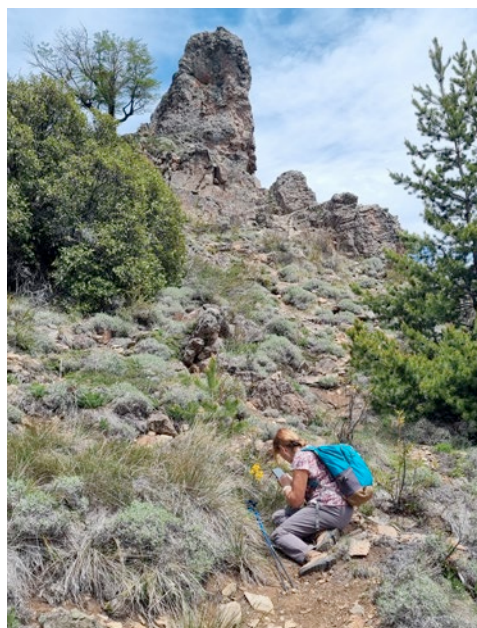
[Dreta] Hàbitat de la Chloraea alpina a El Bolsón. Terreny assolat, aquí és el vessant nord, i pedregós