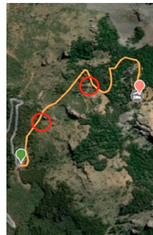
Vaig observar dos nuclis de Chloraea alpina pujant cap al refugi del Piltriquitrón a El Bolsón (Río Negro), Argentina. 26-11-2023